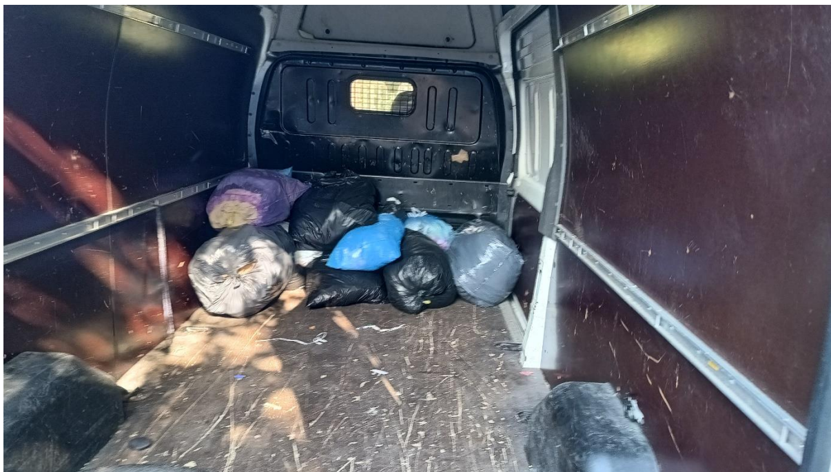
Obrázok č. 2 Obsah kontajnera naložený v aute

Doobeda som bol skontrolovať ako postupujú práce na rekonštrukcii domu smútku a konkrétne ako ukázala nová podlaha.